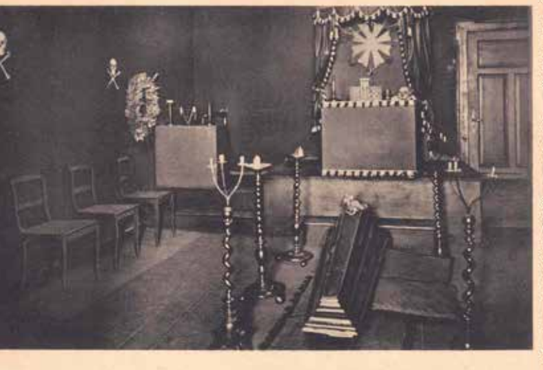
Als Werbung für das „Freimaurer-museum“ gaben die Nazis Ansichtskarten mit „Gruselmotiven“ aus dem Tempel heraus

Die Hetze der NSDAP gegen die Freimaurer machte auch nicht vor so fröhlichen Anlässen wie der Fastnacht halt. Auf einem Foto, ebenfalls aus dem Bestand des Erlanger Stadtarchivs, ist ein schwarzer Wagen eines Faschingszugs zu sehen, auf dem eine Parodie eines Freimaurer-Meisters durch die Straßen gezogen wird, flankiert von unheimlichen Galgenvögeln mit Schurzen und Zylindern. Der Freimaurerloge „Zu den Drei Pfeilen“ in Nürnberg erging es nicht besser.