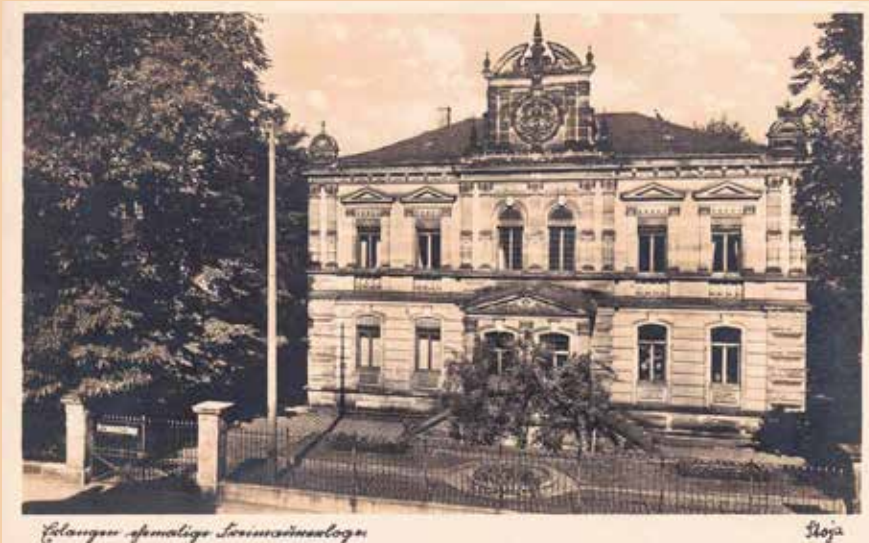
Das Logenhaus Erlangen auf einer Ansichtskarte aus den 1920-er Jahren

von der Stadt erworben. Denn die Beamten im Rathaus und in der örtlichen Parteiführung, allen voran der „Frankenfürher“, NSDAP-Gauleiter Julius Streicher, arbeiteten an einem perfiden Plan: Sie machten aus dem Logenhaus ein öffentliches Grusel-Kabinett für das Rahmenprogramm der Reichsparteitage in Nürnberg. Wer die Symbole nicht versteht, mag sie für satanische Accessoires okkulturer Kreise halten. Verstärkt durch die Nazi-Propaganda muss-