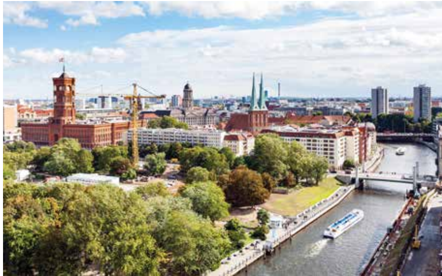
Spree mit Rathausbrücke in Berlin