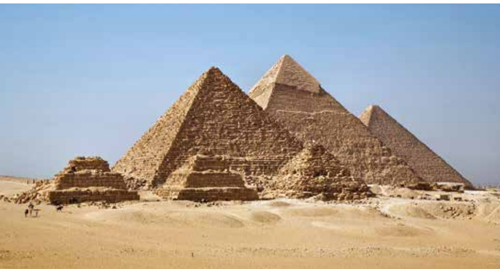
Die Pyramiden von Gizeh, Symbol des Alten Ägypten, einzig erhaltenes Bauwerk der „7 Weltwunder“

Eine besonders oft vertretene Schmucklinie in der Esoterikbranche ist die „Juwelen des Atum Ra“-Kollektion. Die Amulette „tragen den Schlüssel zu heiliger Wahrheit und ewiger Weisheit in sich. Sie eröffnen dem Träger magische Weitsicht und lebensverbessernde Fähigkeiten“, so der Werbetext des Anbieters. Die Beschreibung verweist deutlich auf ägyptosophische Vorstellungen. Darüber hinaus knüpft sie an die Idee der positiven Auswirkungen auf das Leben des Trägers an. Das vermutlich beliebteste Amulett ist das Ankh (anglophon: ankh), bei dem es sich wahrscheinlich ursprünglich um die sym-