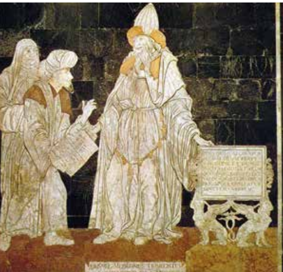
Hermes Trismegistos, Fußbodenmosaik im Dom von Siena. Hier übergibt er die „Urweisheit“ seiner Kultur einem mit Mönchskutte gekleideten Vertreter des Okzidents und einem Vertreter des Orients mit Turban.