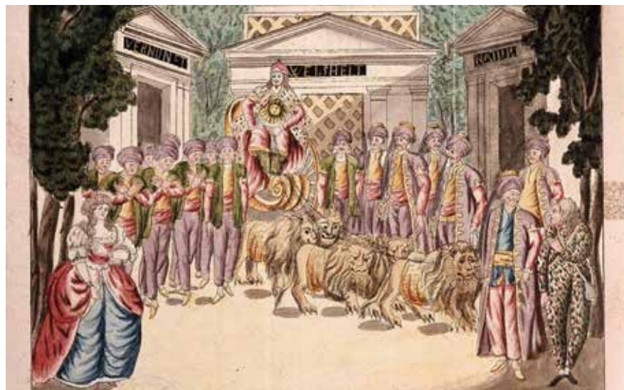
„Es lebe Sarastro“, Design einer Aufführung der „Zauberflöte“ im Jahre 1793 in Brno von Joseph und Peter Schaffer

Die einzelnen Elemente bieten eine Vorlage für viele Rezeptionsstränge, die sich daraus ableiten lassen. Zudem war der Mythos mit den griechisch-römischen Mysterienkulten verbunden, bei denen Initiationsriten durchgeführt wurden. Die Rekonstruktion des Ablaufs gestaltet sich aufgrund der Natur dieser Riten als ebenso schwierig wie die Einschätzung ihrer Bedeutung. Daher verwundert es nicht, dass dieser seit der Antike bekannte, aber dennoch