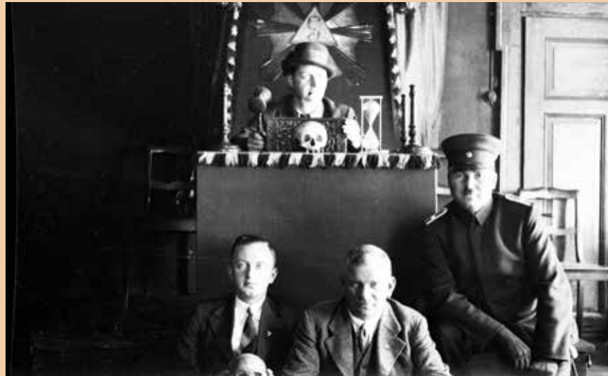
Nazi-Schergen posieren im Tempel der Erlanger Loge

Begeistert berichtet er von einer flammenden Rede des Freimaurers und späteren Medizin-Nobelpreisträgers Charles Robert Richet (1850-1935, Erfinder der Serumimpfung): „Es ist nicht wahr, dass der Krieg zu Mut und Thatkraft erzieht; er verroht. Wir sind Barbaren!“