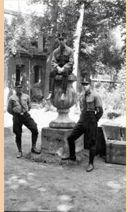
SA und SS besetzen das Erlanger Logenhaus