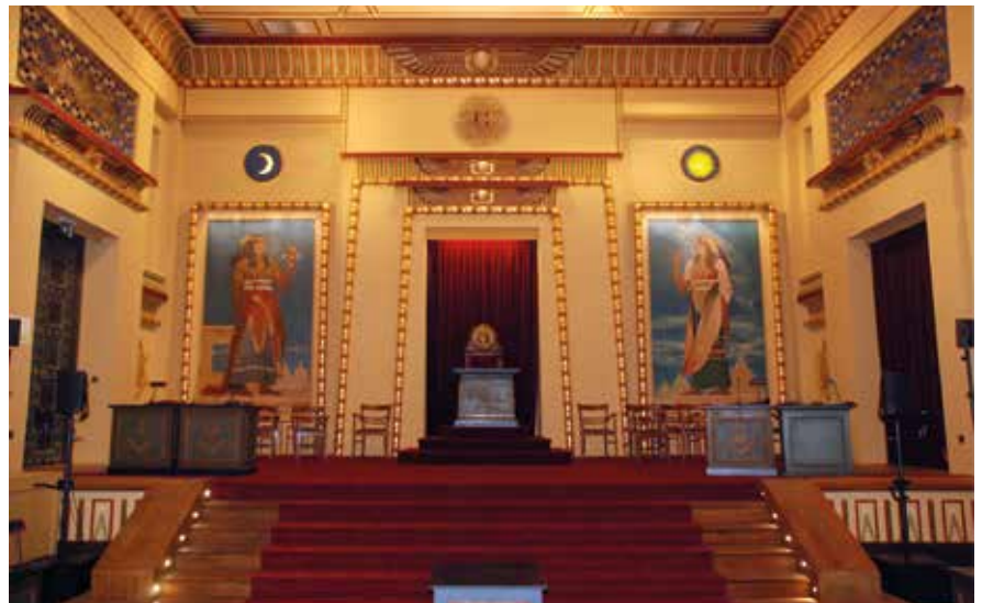
Tempel der Loge „Amis Philantropes“ in Brüssel.

lesen, das seit antiken Zeiten als Quelle eines geheimen Wissens betrachtet wurde. Champollions bahnbrechende Erkenntnis hatte gravierende Auswirkungen auf das bis dahin geltende Ägyptenbild in Europa. Zuvor versuchte sich der Archäologe und Freimaurer Alexandre Lenoir (1762-1839) an der Entzifferung der Hieroglyphen. Einige Forscher sehen dies als die Geburtsstunde der wissenschaftlichen Disziplin der Ägyptologie an. Eigentlich erforscht die