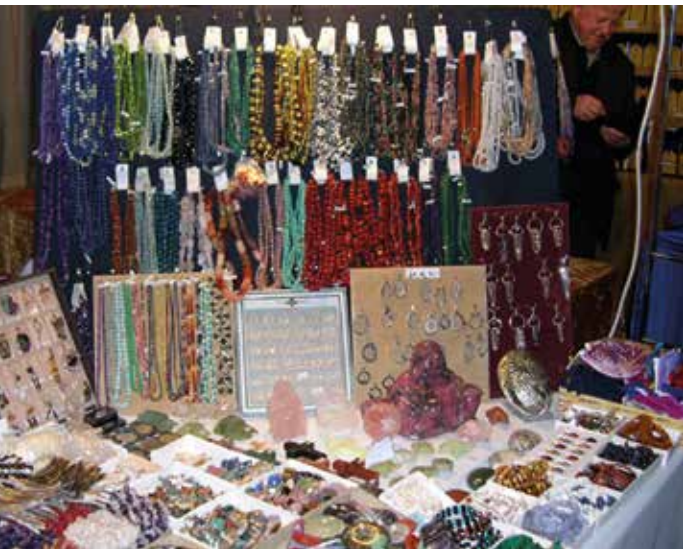
Amulette, Heilsteine und andere Kultgegenstände bei einer Esoterik-Messe im Berliner Logenhaus

waren. Ihre Neuentdeckung trug zum Aufleben ägyptosopischer Vorstellungen bei. Allerdings stellte Isaac Causabon 1614 fest, dass es sich um ein spätantikes Werk handelt. Demnach war Hermes Trismegistos auch keine historische Persönlichkeit aus dem alten Ägypten. Dennoch blieb die Faszination für Ägypten bestehen.