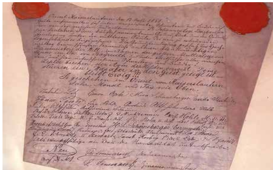
Die Kaiserslauterer Freimaurerloge „Galilei“ feierte ihr 70-jähriges Bestehen. Schriftstücke zur Geschichte der 1864 ins Leben gerufenen Vorgänger-Loge „Barbarossa zur deutschen Treue“ hüten bis Mitglieder bis heute.