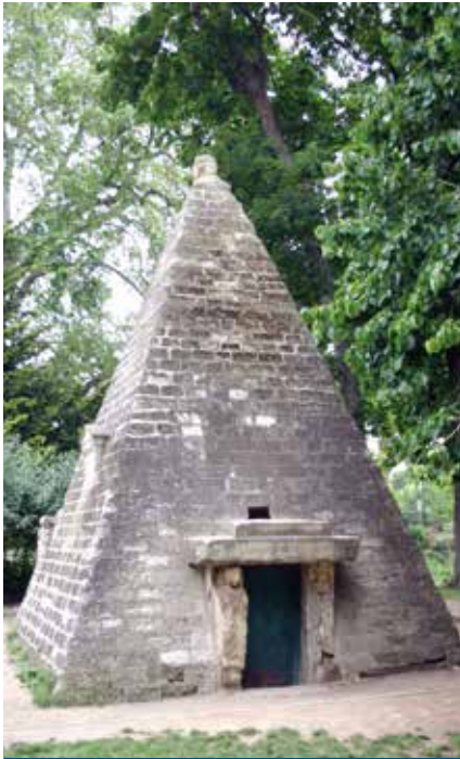
Die Pyramide im Garten „Monceau“ in Paris

fand und sie deshalb durch eine Maschine humanisieren wollte.