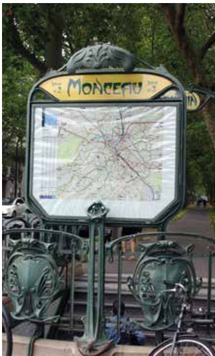
Die Metrostation Monceau in Paris

V on allen Landschaftsgärten in Frankreich ist der Parc Monceau am leichtesten zu erreichen, denn er liegt mitten in Paris an der Métrostation Monceau.