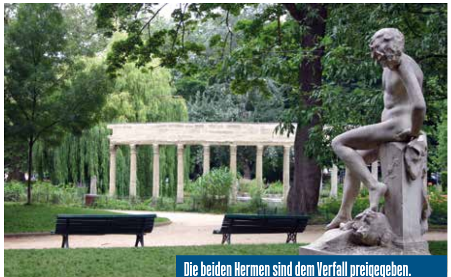
Die beiden Hermen sind dem Verfall preisgegeben.