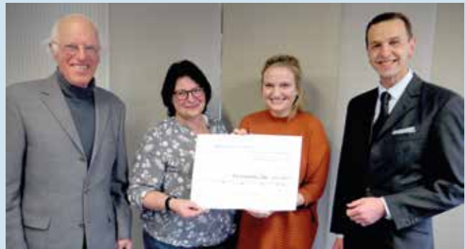
(v.l.n.r.): Scheckübergabe in Esslingen: Der mit 1500 Euro dotierte Preis ging an den „Arbeitskreis Leben“

gensteuern. Und so fügte Br. Alexander Ruffner hinzu: „Auch, wenn wir nur Geld in die Arbeit des ‚Arbeitskreises Leben‘ geben können, so haben wir die Hoffnung, dass Betroffenen in Not der Weg zum Leben wieder frei und klar gemacht wird!“ Die Mitglieder der Esslinger Loge hatten erfahren, dass es selbst im Landkreis Esslingen etwa 50 Menschen jährlich