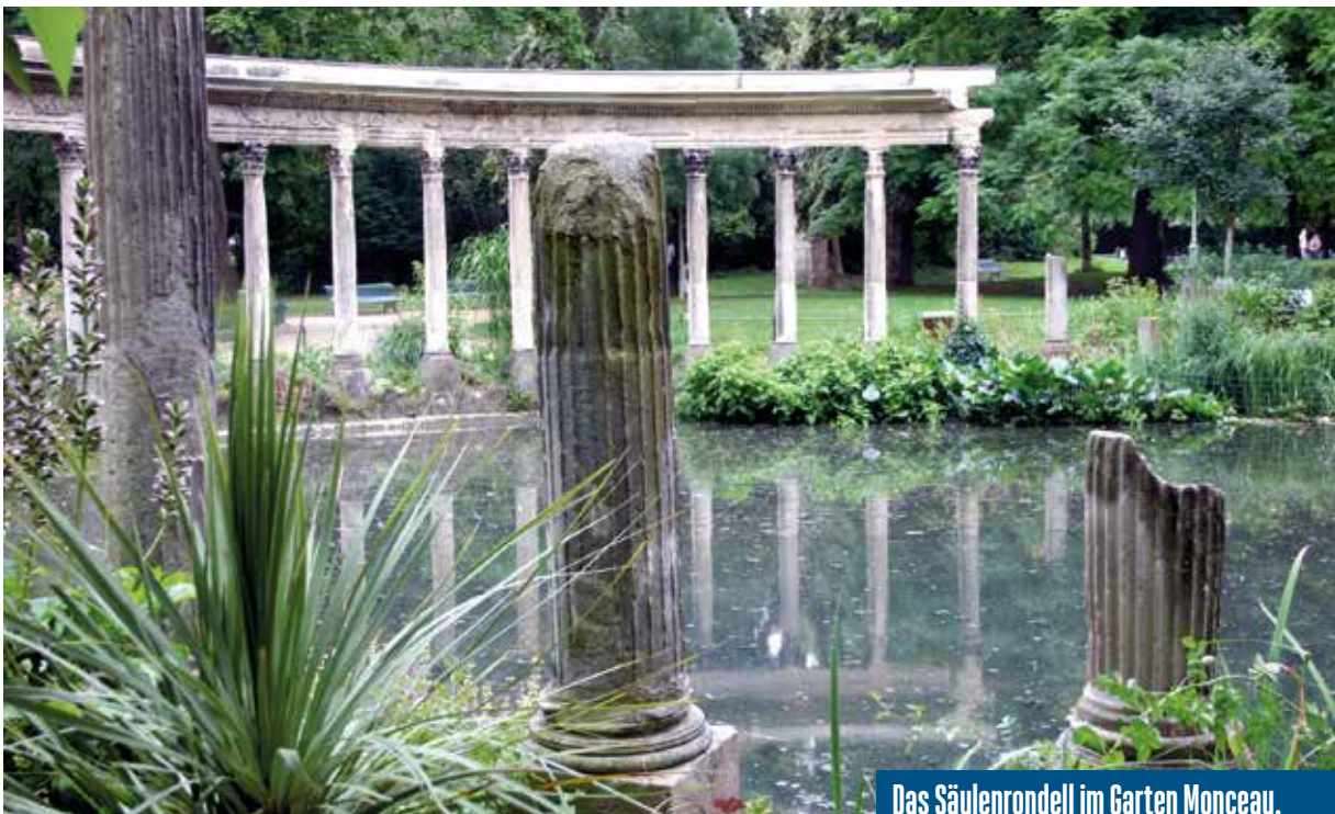
Das Säulenrondell im Garten Monceau.

Es stellt sich die Frage, ob sich die Besichtigung des Gartens heute noch lohnt? Ohne Hintergrundwissen wird man möglicherweise von dem Garten enttäuscht sein, weil die meisten Architekturen durch die Verkleinerung des Gartens zerstört wurden. Die vorhandene Pyramide und das Säulenrondell, aber auch die Stimmung im Garten sind ein Erlebnis. Der Garten wird von der Stadtbevölkerung sehr gut angenommen, vor allem auch von Kindern, weil er die einzige Grünfläche in diesem dicht bebauten Stadtteil ist. Zudem kann man die Gartenbesichtigung